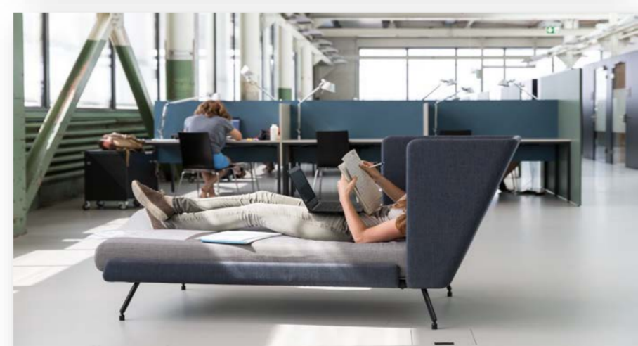
Hochschulbibliothek der ZAHW, Standort Winterthur