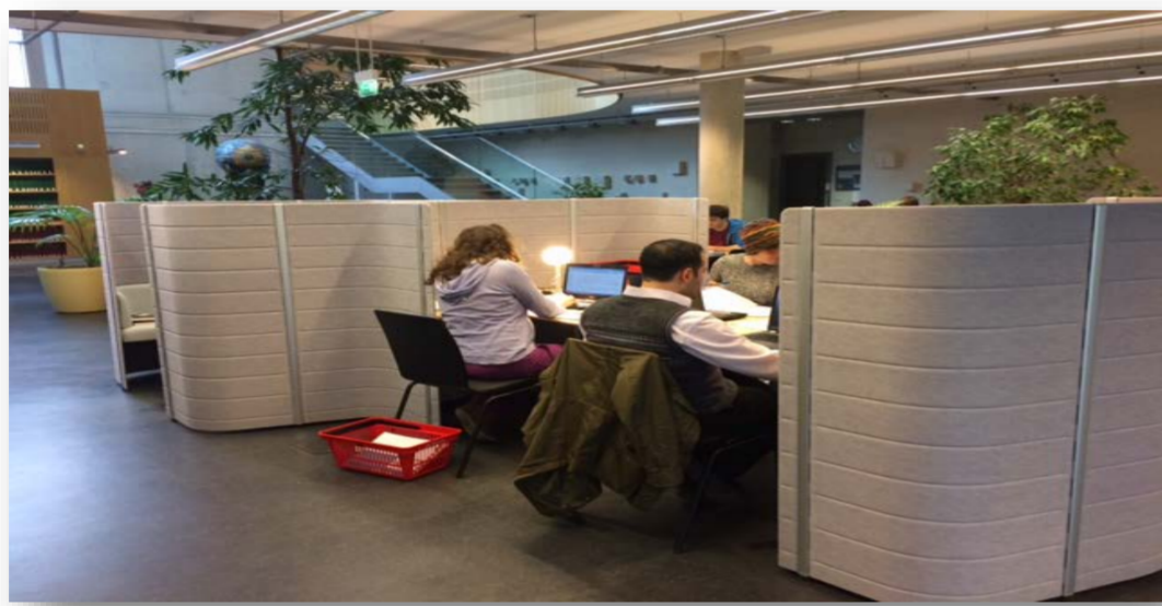
Gruppenarbeitsplätze in so genannte Buchten: „Workbays“, UB Rostock, 2014