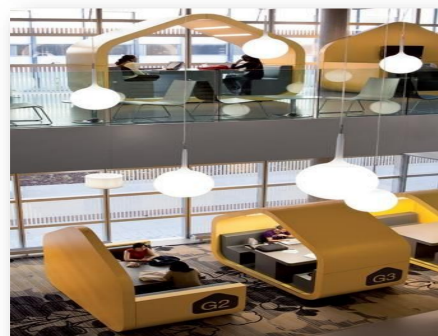
Coventry University (England), Student Hub