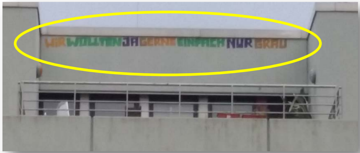
Schnappschuss von einem Studentenwohnheim in Bielefeld, Universitätsstraße, 2015